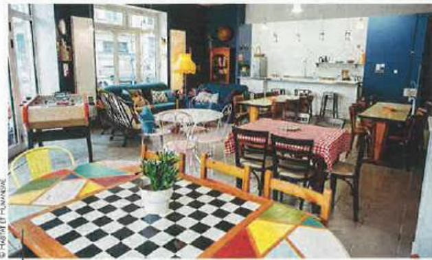
Dans les 145m 2 de l'Escale Solidaire du 3, une table d'hôtes, des ateliers et des activités pour aider à la réinsertion.

« Les entreprises sont de plus en plus engagées dans l'associatif. On organise même des team building avec des cadres de grands groupes qui viennent à la rencontre des résidents, préparer le repas, dresser la table, faire la vaisselle », ajoute le responsable.