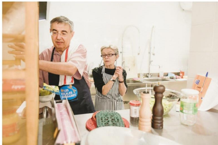
Deux bénévoles dans la cuisine des Escalles solidaires.