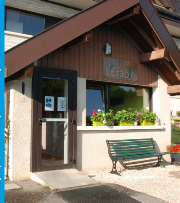
Création graphique : Omas Noko / Crédits photos : Christophe Pouget.