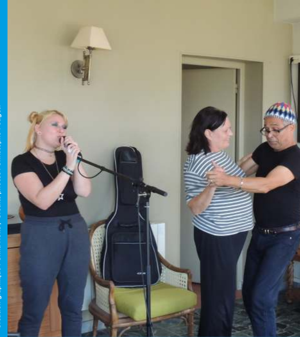
Création graphique : Omas Noko