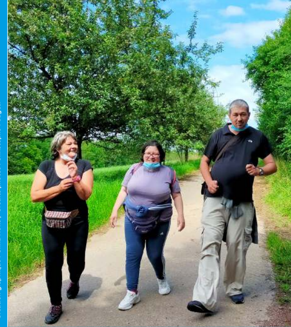
Création graphique : Omas Noko