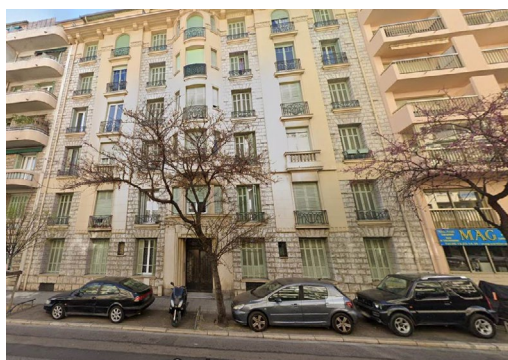
Façade de l'immeuble boulevard Grosso à Nice.