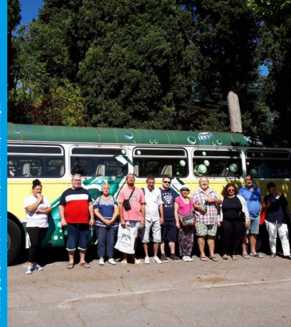
Création graphique : Omas Noko / Crédits photos : Christophe Pouget.