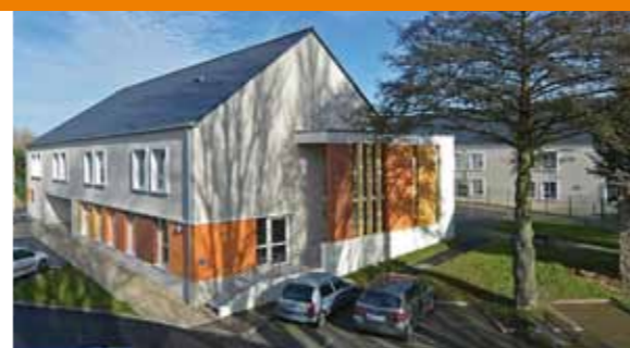
Reconstruction de l'EHPAD de Saint-Malo