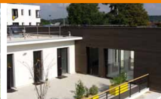
Réhabilitation/extension de l'EHPAD Lépine Providence à Versailles