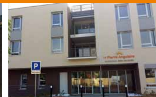
Reconstruction de l'EHPAD Bon Secours à Rillieux-la-Pape