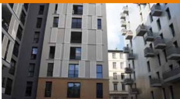
Construction sur l'ancien site des prisons de Lyon, de l'Espace Emmanuel Mounier, habitat intergénérationnel et solidaire