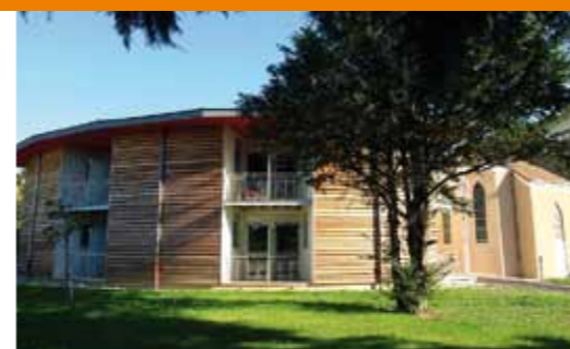
Réhabilitation de l'EHPAD de Loriot