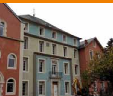
Réhabilitation de l'EHPAD de Saint-Affrique

EHPAD : Etablissement d'Hébergement pour Personnes Agées Dépendantes.