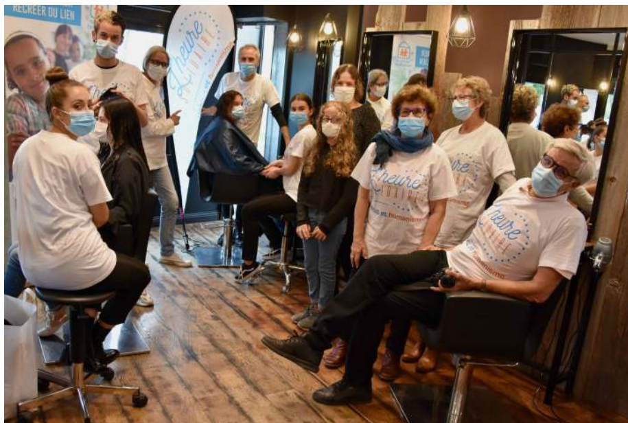
Heure Solidaire 2020 : Coiffure et manucure offertes à nos locataires