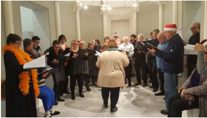
Représentation décembre 2017 Salle Concordia - Maison Monsieur Vincent