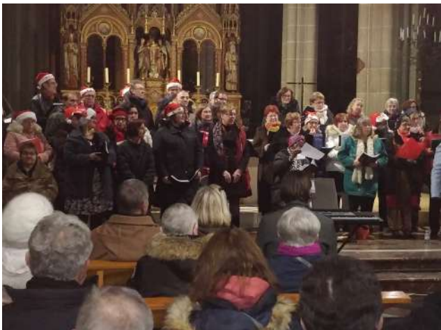
Représentation décembre 2018 Eglise Sainte Anne