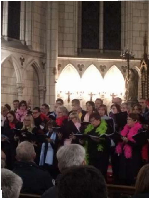
Représentation décembre 2017 Chapelle de la Sainte Famille