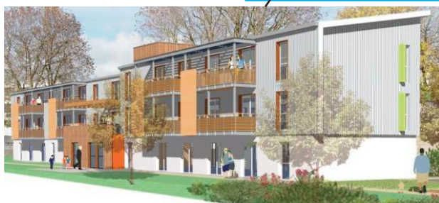
Une Résidence Intergénérationnelle de 26 logements.