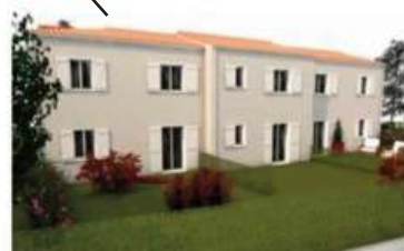
La Garenne résidence bigénérationnelle de 6 logements