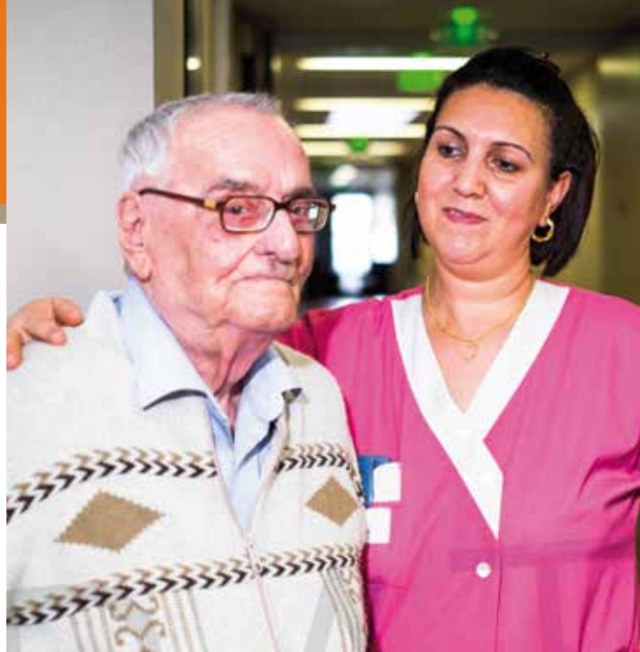
Exposition photos de Notre-Dame de L'Isle