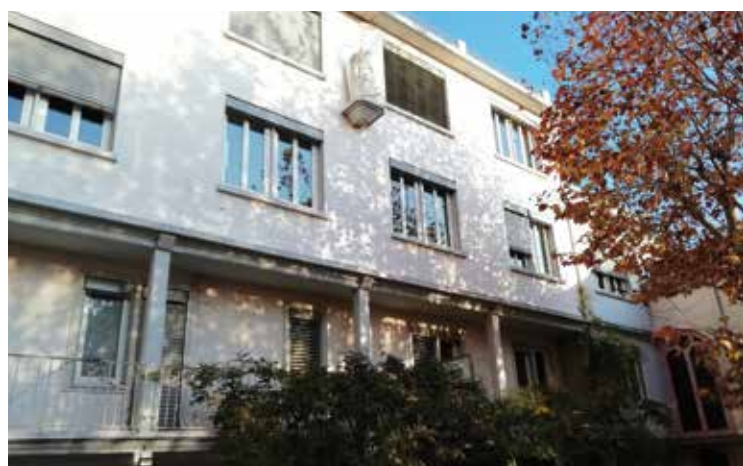
La résidence Yves Leprince à Lyon (69)

Cet enjeu national de la raréfaction du personnel formé est pris en compte dans les directives actuelles, illustrées notamment par le rapport LIBAULT qui en fait une de ses priorités : investir dans l'attractivité des métiers du grand âge, à domicile comme en établissement.