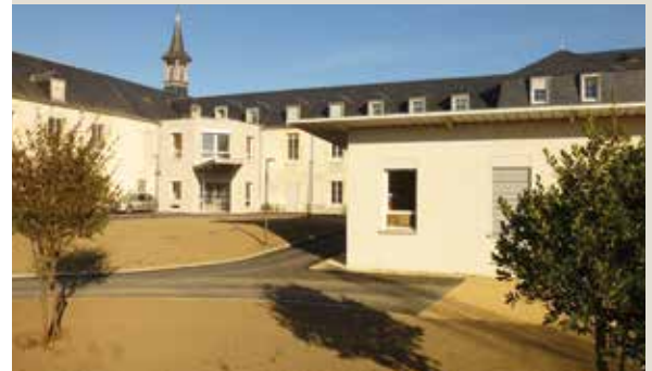
Notre Dame de la Providence à Varennes-Vauzelles (58)