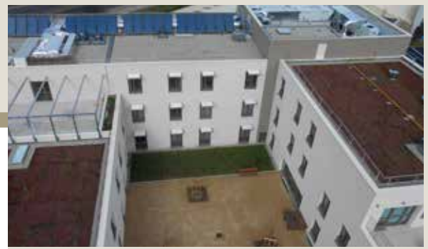
Notre Dame de l'Isle à Vienne (38)