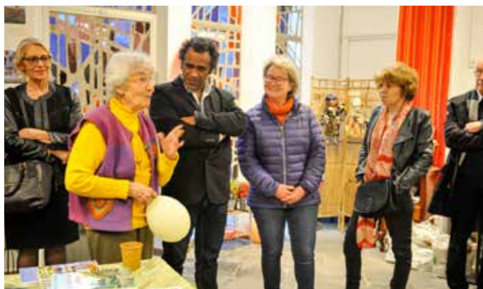
Exposition des œuvres d'une des résidentes

À Nice, au coeur du quartier résidentiel Saint-Maurice, la résidence Fabrice Cayol, dispose de 27 appartements à loyer modéré pour jeunes, 8 logements pour des personnes âgées autonomes et 3 logements pour des familles. Elle comprend également une salle commune qui permet l'organisation d'échanges et de temps festifs.