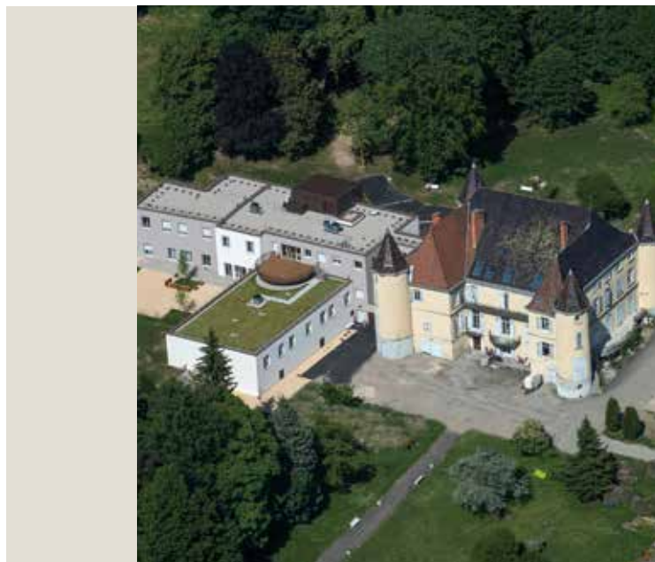
EHPAD Val Marie à Vourey (38)

*** Services polyvalents d'aide et de soins à domicile