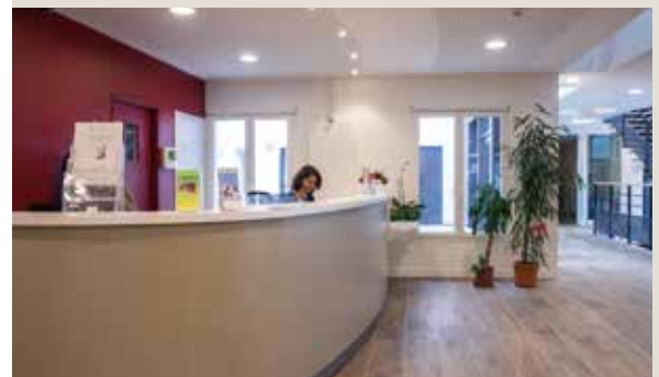
Plateforme gérontologique Lépine Versailles à Versailles (78)