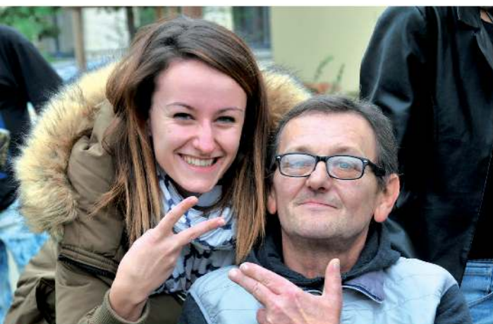
Première association à proposer de la colocation intergénérationnelle en Ile-de-France