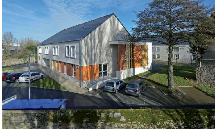
EHPAD Plessis-Pont-Pinel à Saint-Malo (35)