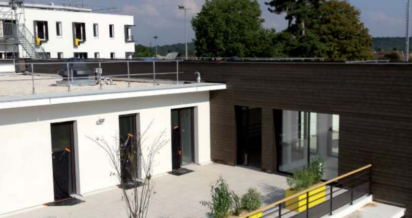
EHPAD Lépine Versailles à Versailles (78)