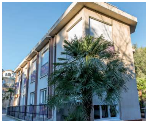
La Maison des Pères Blancs à Bry-sur-Marne (94)