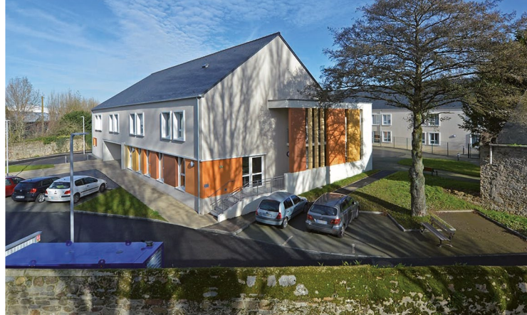
EHPAD Plessis-Pont-Pinel à Saint-Malo (35)