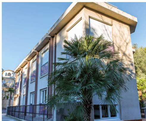
La Maison des Pères Blancs à Bry-sur-Marne (94)