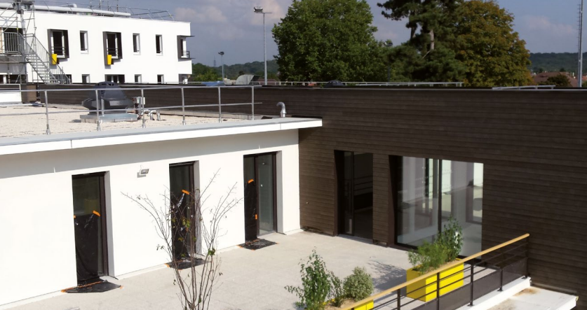
EHPAD Lépine Versailles à Versailles (78)