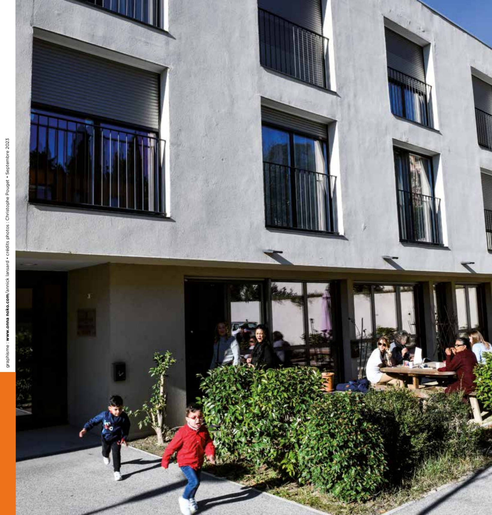
graphisme : www.onna.noko.com/annick.lansard • crédits photos : Christophe Pouget • Septembre 2023

Société Foncière d'Habitat & Humanisme INVESTIR POUR AGIR !