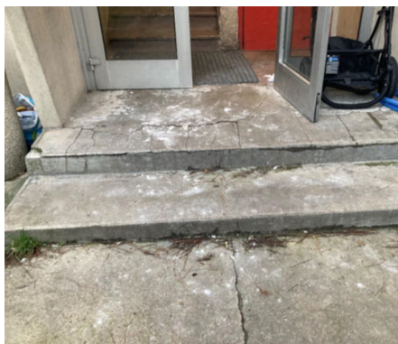
Emmarchement au rez-de-chaussée