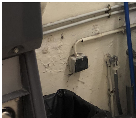
Électricité au sous-sol