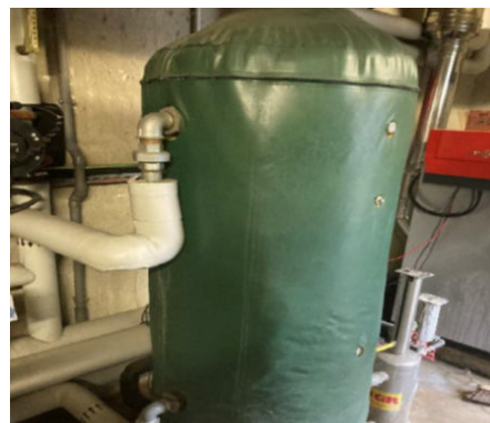
Ballon d'eau chaude