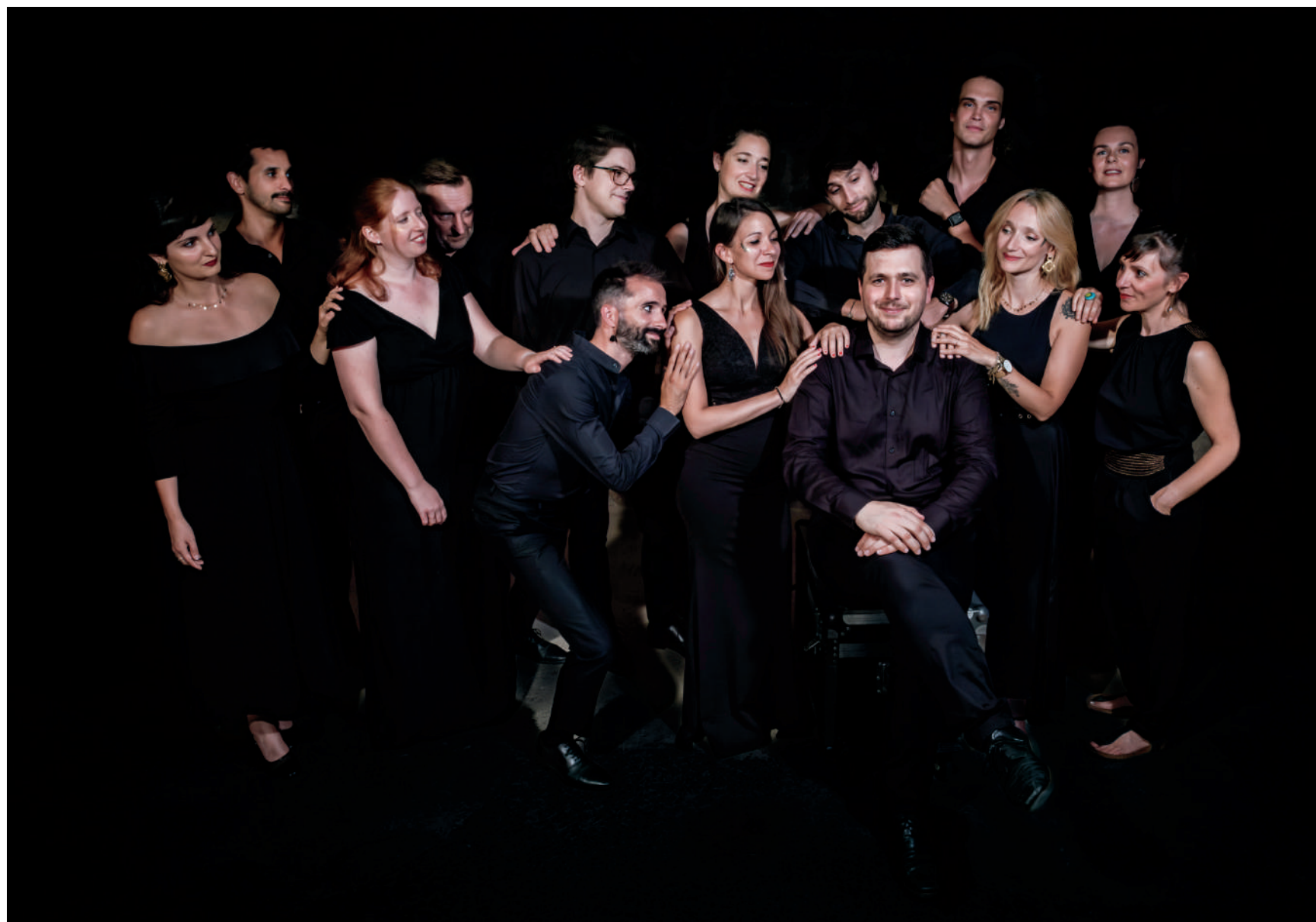
© Alex J Overton / Anima Nostra