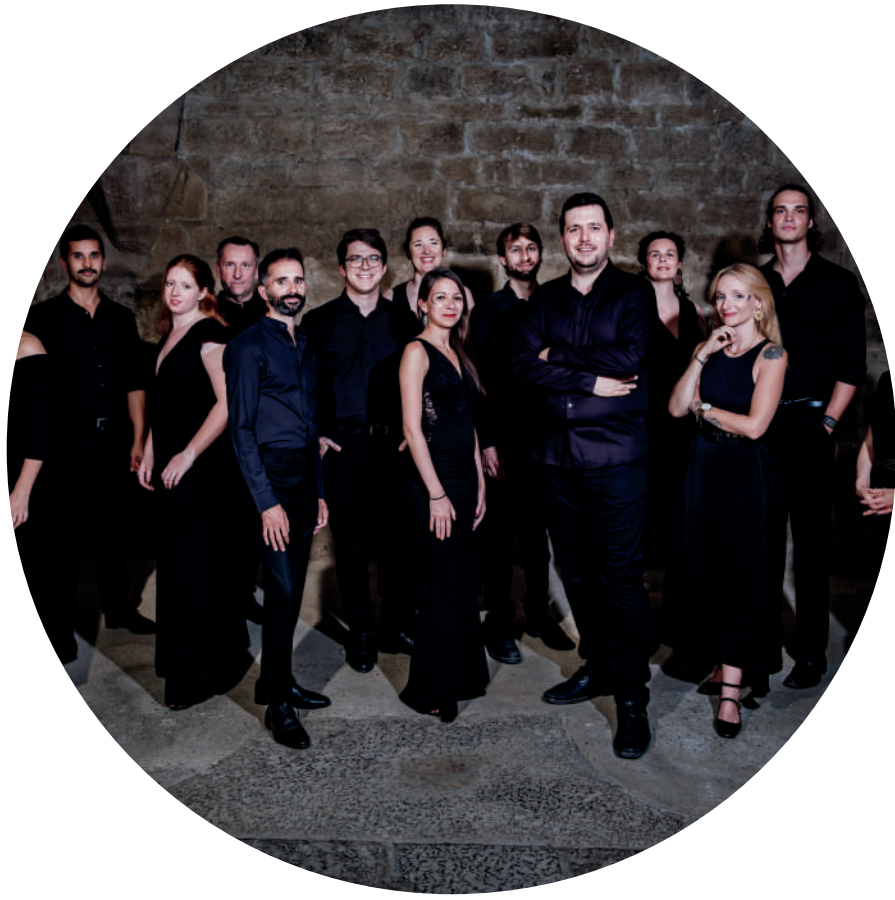
Dulci Jubilo