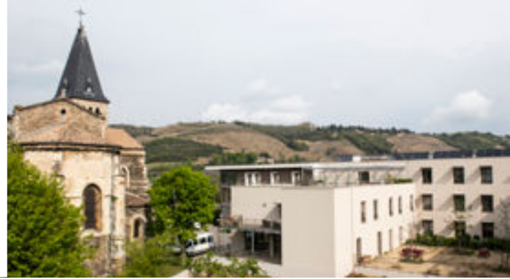
EHPAD Notre-Dame de l'Isle à Vienne (38)