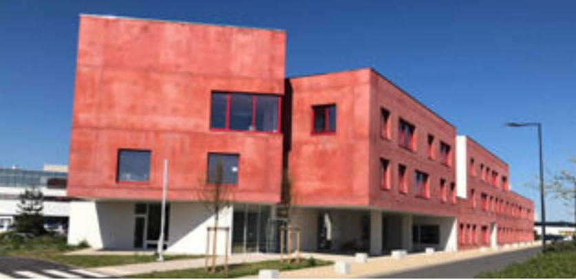
EHPAD et Résidence inclusive Villars Accueil à Moulins (03)